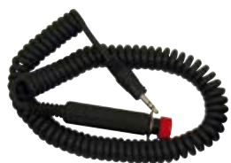
Comando azzeramento remoto.