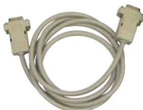
Cavo di connessione del secondo display.