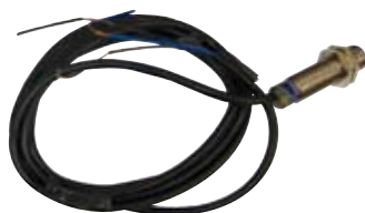
Sonda con cablaggio.