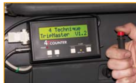
Particolare del display principale in funzionamento.