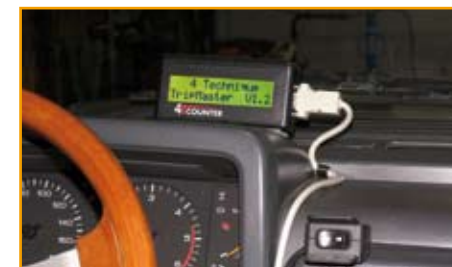
Particolare del display pilota in funzionamento.